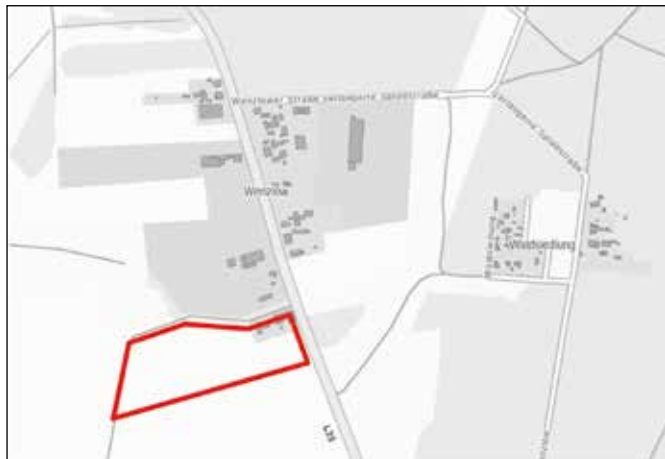
Übersichtsplan: Räumlicher Geltungsbereich des Bebauungsplans „Gewerbegebiet Wenzlow/ Köpenicker Chaussee“ (ohne Maßstab)

Der Geltungsbereich befindet sich unmittelbar südlich der Ortslage von Wenzlow, zählt aber bereits zum Ortsteil Friedersdorf. Der Ortskern von Friedersdorf befindet sich ungefähr 2 km südlich des Plangebiets. Das Grundstück liegt nahe der Autobahnabfahrt Friedersdorf an der A 12 Berlin – Frankfurt/Oder. Das Plangebiet liegt in der Gemarkung Friedersdorf Flur 3, Flurstücke 83 und 85. Die Fläche des Plangebiets beträgt ca. 2,9 ha.