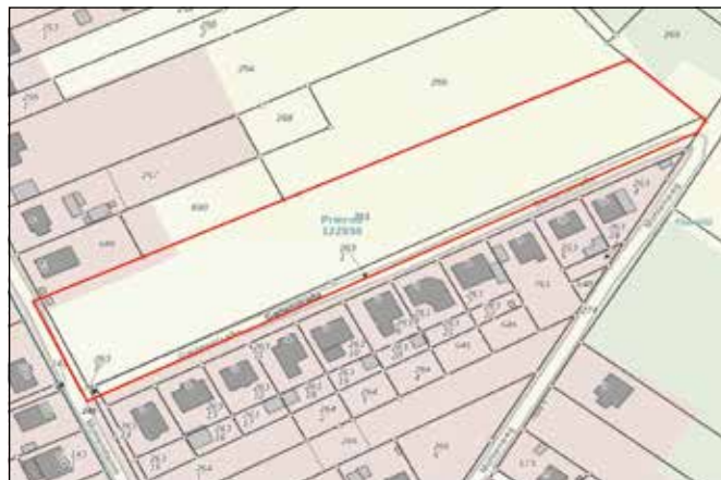
Übersichtsplan: Räumlicher Geltungsbereich des Bebauungsplans „Gartenstraße“ (ohne Maßstab, Plangrundlage: Landesvermessung und Geobasisinformation Brandenburg, 2022)

Das Plangebiet grenzt unmittelbar an das Landschaftsschutzgebiet „Dahme-Heidesee“.