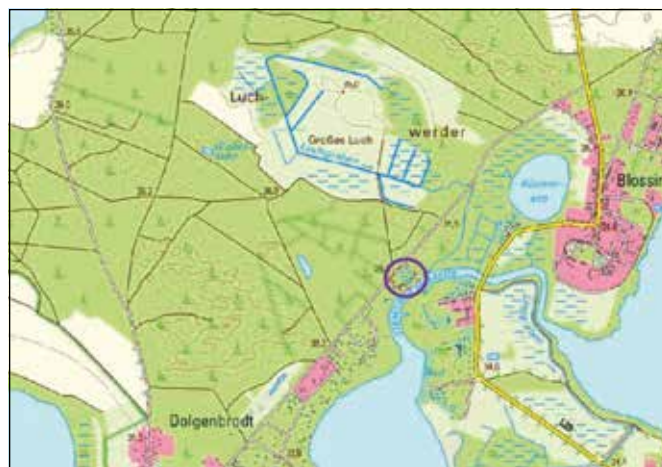
Anlage: Übersichtskarte mit Darstellung des Geltungsbereiches