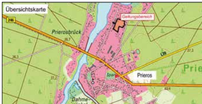
Übersichtskarte mit Darstellung des Geltungsbereiches